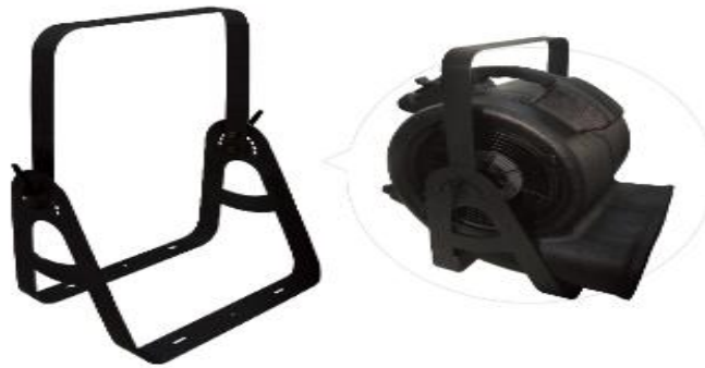
OPTIONAL AF-5-HB Hanging Bracket