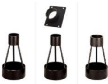
FTA-1 FTA-2A FTA-3